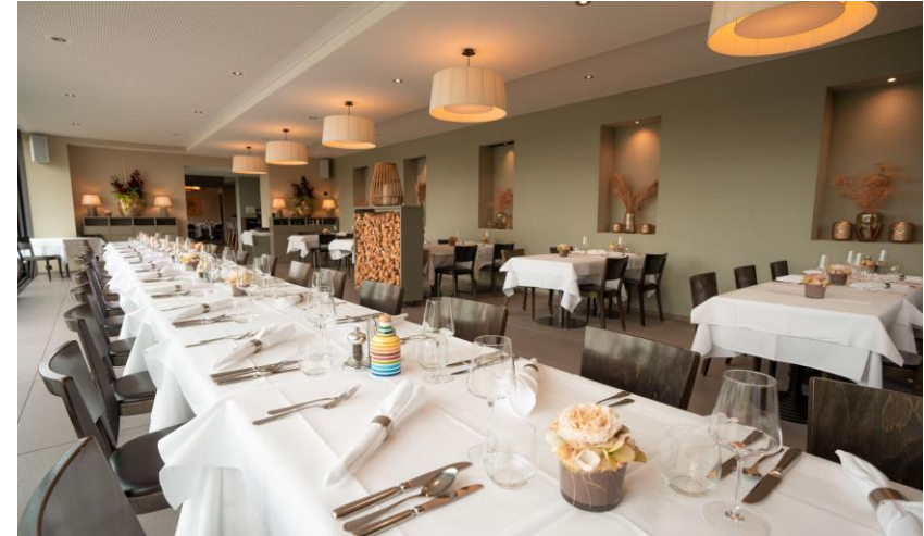
Panoramabau (bis 60 Personen)