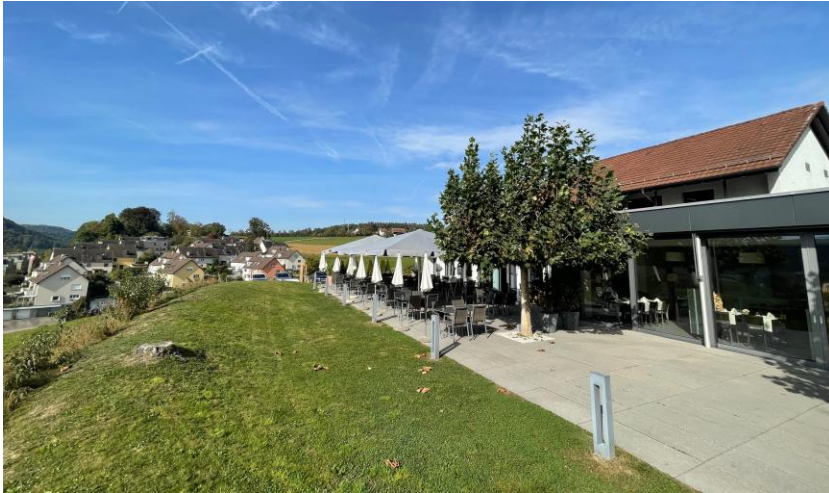
Gartenterrasse (bis 110 Personen)