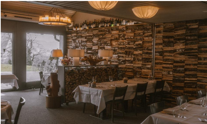
Säali (bis 40 Personen)